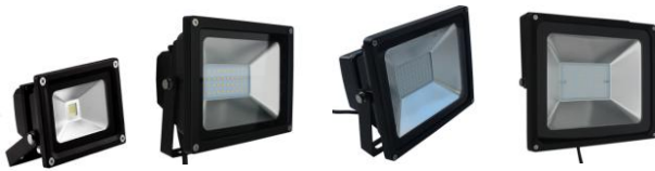
A B C D